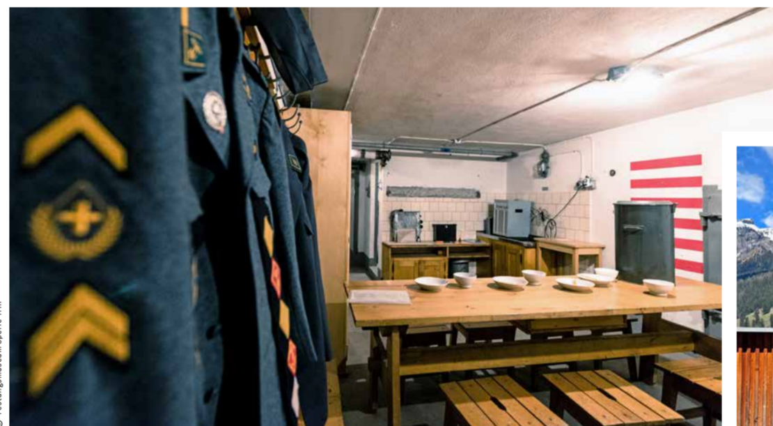
Im Hauptwerk: Alles bereit zum Essen. In the 'Hauptwerk': all ready to eat.

Das «Herzstück» der Sperre Trin ist eine Infanteriefestung, militärisch auch als Hauptwerk bzw. Infanteriewerk bezeichnet. Diese befindet sich in der Enge von Porclis, hineingesprengt und -gehauen in die beiden Felsköpfe Crap Sogn Barcazi und Crap Pign. Zur Sperre gehören zudem sieben Bunker im Raum Porclis und in südlicher Richtung an der Plaun Laséaz. Sie sind getarnt als Wasserversorgung, Holzscheune, Waldhütte oder ihr Eingang versteckt sich hinter einem künstlichen Felsen. Auch zwei Geländepanzerhindernisse sind noch vorhanden. Alle Anlagen wurden zwischen 1941 und 1943 von regionalen Firmen in Windeseile errichtet, worüber sich die Besucher der Sperre heute nur noch wundern können. Was damals in Trin im Berg oder unter der Erde gebaut worden ist, war auch nach Ende des Zweiten Weltkriegs weiterhin streng geheim. Erst Mitte der Neunzigerjahre wurde die Sperre Trin aus der Geheimhaltung entlassen. Die Gemeinde konnte in der Folge die Festung übernehmen und seit 2009 ist sie der Öffentlichkeit zugänglich.