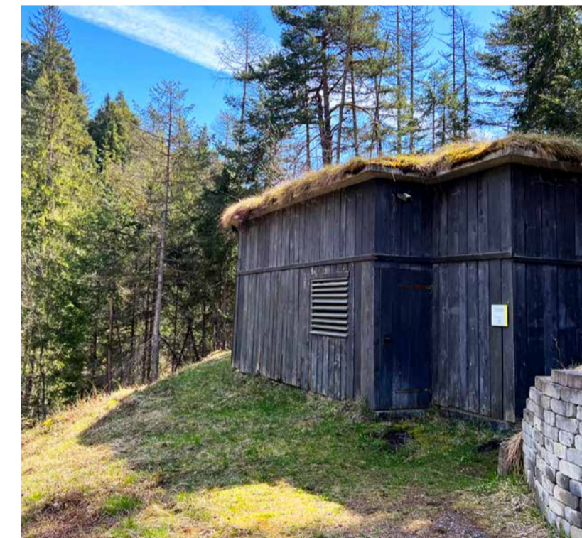
Der Bunker «Porclis Nord». 'Porclis North' bunker.