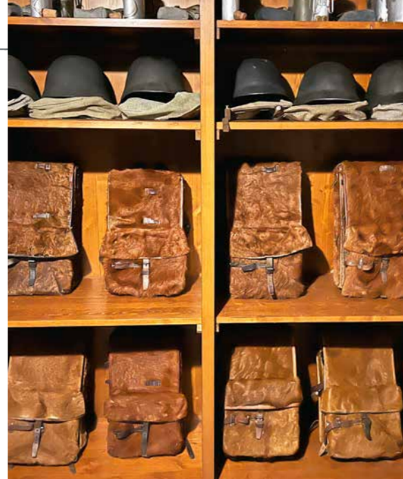
Regal mit Felltornistern im Bunker «Laseaz Nord». Fur military packs stand side by side on racks in the 'Laseaz Nord' bunker.