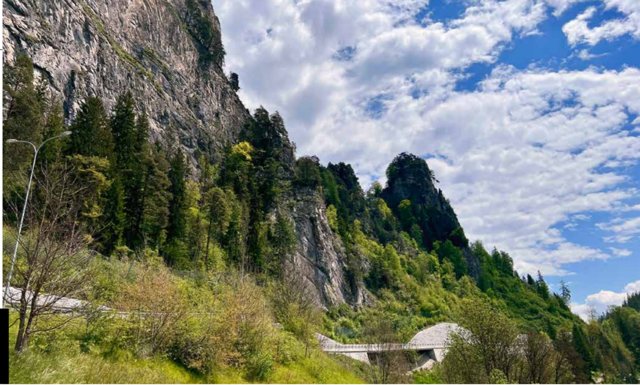
Das Hauptwerk der Sperre Trin liegt in den Felsköpfen Crap Barcazi (ganz rechts) und Crap Pign. The 'Hauptwerk' of the Trin fortifications is located in the two rocky outcrops Crap Barcazi (far right) and Crap Pign.

Geheimnisvoll, heimlich, im Verborgenen – in Trin präsentiert sich eindrucksvoll, wie sich die Schweiz in der Vergangenheit für kriegerische Angriffe gewappnet hat.