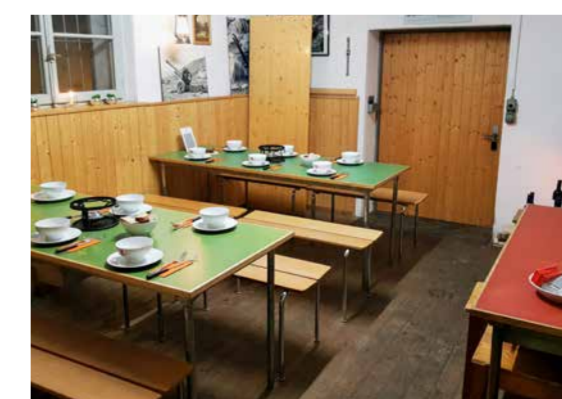
Im Festungsbeizli gibt es Getränke und kleine Speisen. Drinks and snacks are available in the Festungsbeizli.