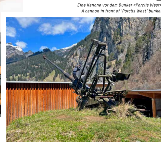
Eine Kanone vor dem Bunker «Porclis West». A cannon in front of 'Porclis West' bunker.