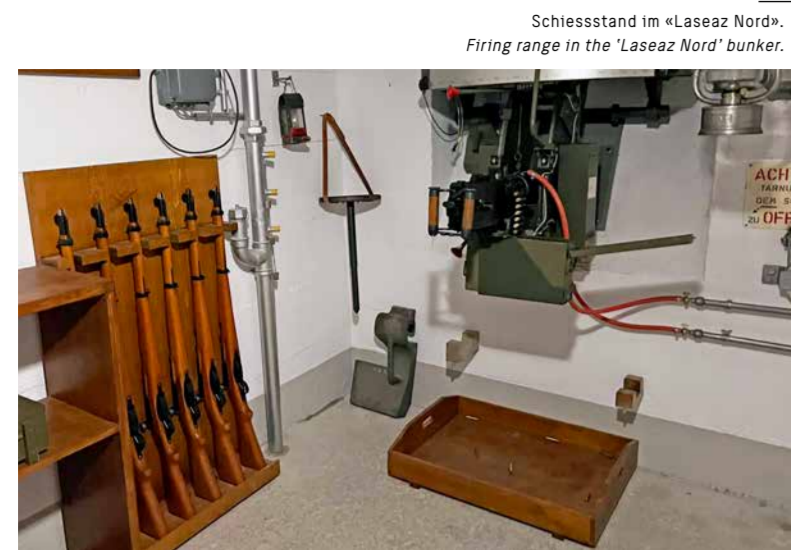
Schiessstand im «Laseaz Nord». Firing range in the 'Laseaz Nord' bunker.