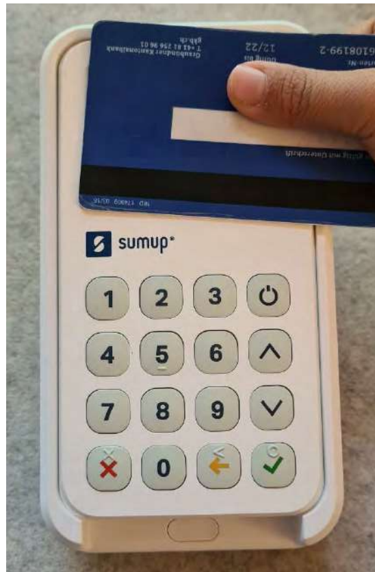
6. Karte kontaktlos auf das Gerät halten.