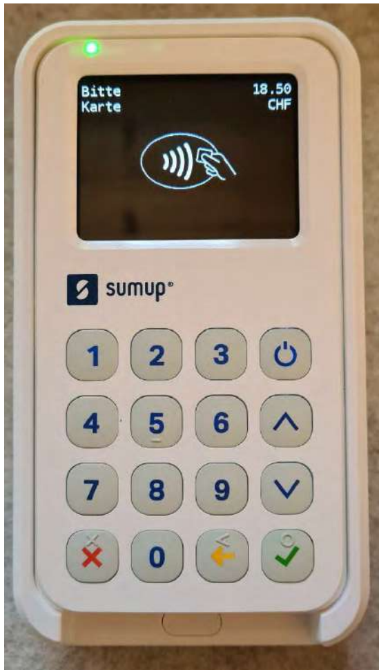
5. Es erscheint «Bitte Karte»