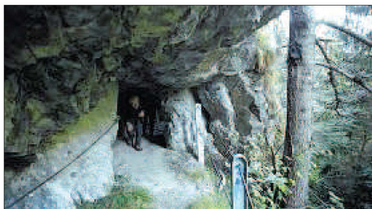
Bereits der Zugang zum Festungseingang ist abenteuerlich im Felsen eingehauen.