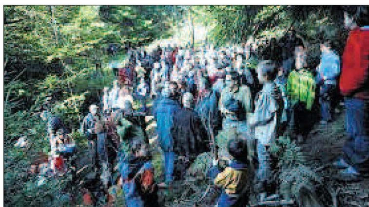
Vergebliches Warten im Wald: Viele verzichteten angesichts der Wartezeit auf den Besuch der Stollen im Berg.