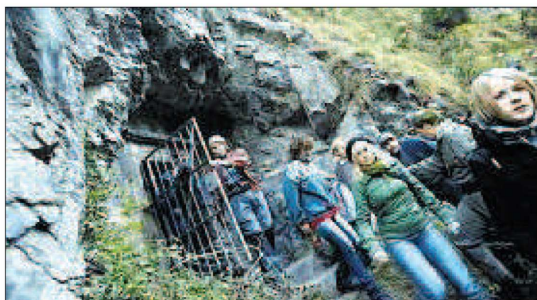
Wohl erstmals in der Geschichte der Trinser Sperre haben an einem Tag so viele Leute die Felskavernen besucht.