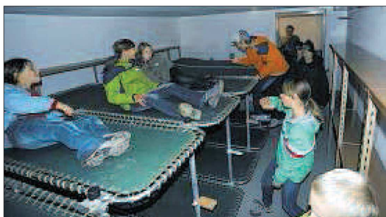
Hier im Berginnern hatten die Festungssoldaten auch ihre Unterkunft.