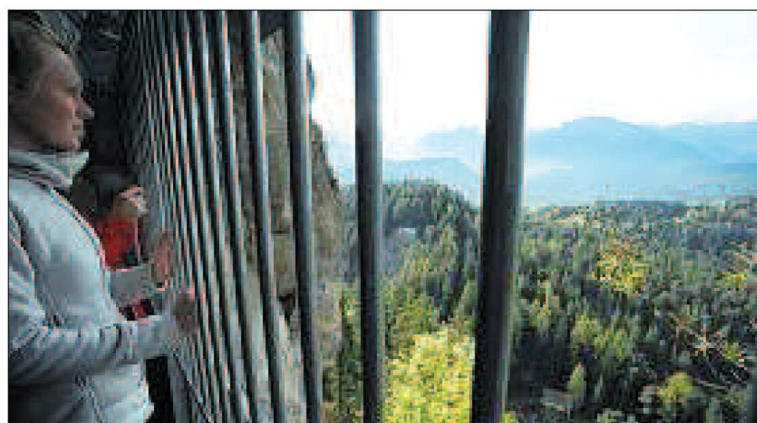
Aussicht vom in der Felswand des Crap Sogn Barcazi angelegten, einst mit Seilbahn erschlossenen Stellungseingang.