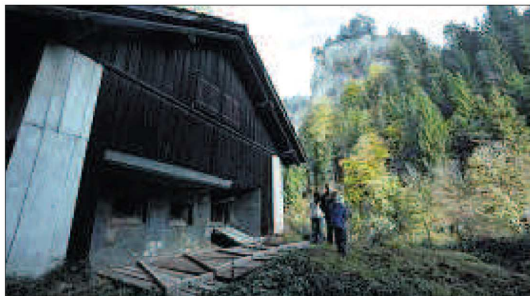
Der vermeintliche Stall beim Trinser Werkhof offenbart sein wahres Innenleben als Abwehrstellung.